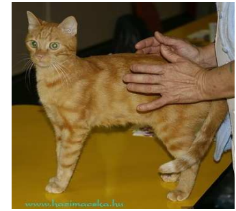
RW SGM Tommy