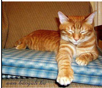
RW SGM Parazs