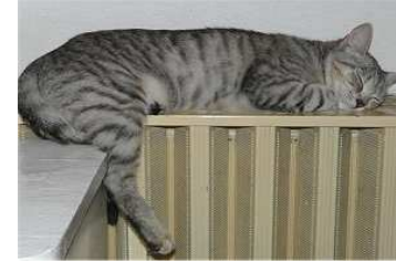
RW Jeanne D'Arc