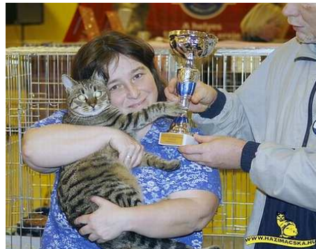
RW Gyömrői Tigris