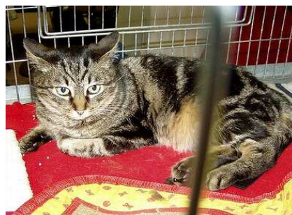
RW SGM St. László Sissy Princess