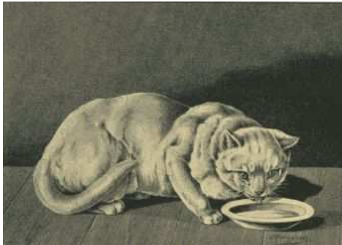
Fig. 11. Weiße Hauskatze.

Die weiße Varietät (Fig. 11) ist ziemlich gemein und man hält sie für sehr weichlich und nicht so widerstandsfähig wie die vorigen. Obschon weiße Katzen mit blauen Augen, im sauberen Haarkleid recht anmutige Tiere sind, sieht man sie in den Städten doch recht selten in properem Zustande.