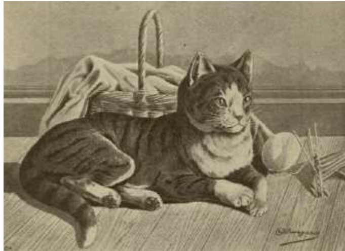
Fig. 9. Graue Hauskatze mit weißen Abzeichen.

Die Grundfarbe ist mehr gelbgrau, das Gelbe an den Läufen, der Brust, nach dem Bauche zu und im Gesicht etwas auffallender; der Körper ist mit dunklen schwarzgrauen Querstreifen und Binden geziert. Katzen, die statt der Quer-, Längsstreifen zeigen, zählen zu den großen Setlenheiten. Das Auge ist grünlich-gelb, die Nase, sowie die Lippen und auch vielfach die Sohlen schwarz oder doch wenigstens schwarz gefleckt.