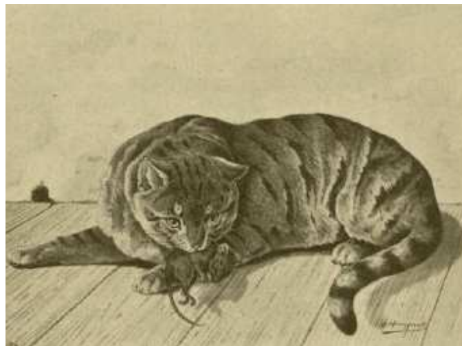
Fig. 8. Wildfarbige oder graue und schwarzgestreifte Hauskatze.

In Bezug auf Bildungen von Rassen, hat die Hauskatze so Ziemlich ihre Selbständigkeit gewahrt und sich wenig verändert. Bei allen anderen Haustieren finden wir eine Menge Rassen und Varietäten, dagegen sind diese bei der Hauskatze sehr spärlich vertreten. Ihr ungebundenes Leben, ihr Freiheitsdrang, ihre Selbständigkeit und Eigenliebe, ließen eine Zucht im Sinne der heutigen Zuchtregeln nicht zu da sie sich nur sehr schwer in die beengenden Verhältnisse derselben pressen läßt und Umbildungen, die sie allenfalls durchgemacht, sind höchstens in der Farbe und der Struktur des Haares zu erkennen und wahrzunehmen. Im Körperbau ist sie dieselbe geblieben, und eine wirkliche Abänderung in gewissen Körperteilen lassen sich höchstens bei der hängeohrigen Katze aus China und bei der schwanzlosen Katze von der Insel Man (zu England gehörige Insel in der Irischen See) feststellen.