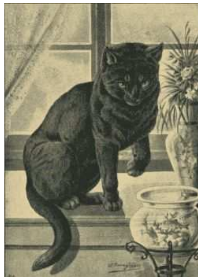
Fig. 10. Schwarze Hauskatze.

Diese Varietät ist auch meist wilder, wie die übrigen, zeichnet sich durch größeren Selbsterhaltungstrieb aus, verwildert leichter und paart sich auch am ehesten mit der Wildkatze, deren ganzen Charakter sie annimmt, wenn sie die Wohnung des Menschen verläßt und draußen wildernd umherstreift. Man ist allgemein der Ansicht, daß sie die beste Mausekatze ist.