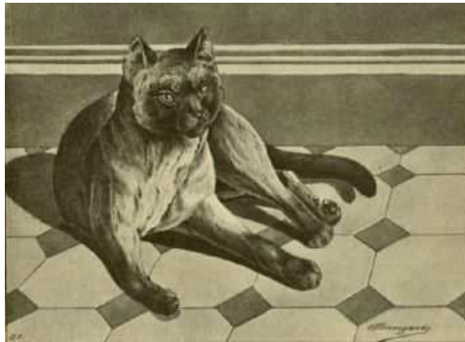
Fig. 19. Siamesische Katze.

Von Charakter ist sie entschieden noch träger wie die Angora-Katze, beinahe faul zu nennen und sozusagen ohne Leben; auch liegt sie am liebsten hinter dem warmen Ofen, ist wenig empfänglich für Schmeichelei, hört schlecht und entwickelt höchstens Leben, wenn sie den Milch- oder Freßnapf erblickt. Wirklich anziehende Eigenschaften besitzt sie nicht und höchstens die eigenartige Erscheinung könnte zur Haltung des immerhin merkwürdigen Vertreters des Hauskatzensgeschlechts verleiten.