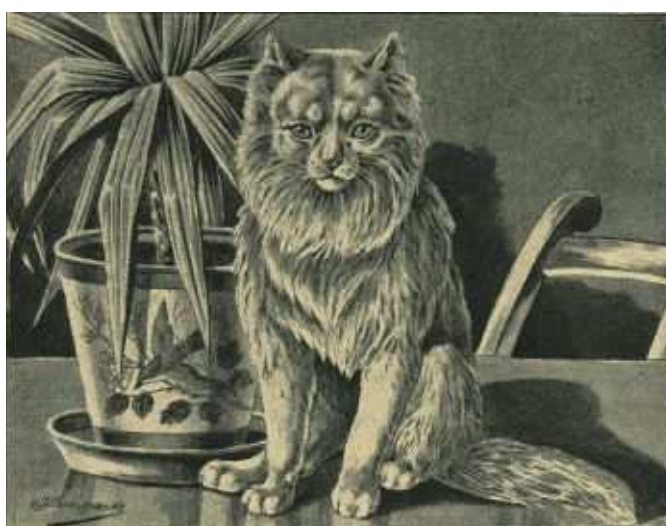
Fig. 15. Karthäuser-Katze.

Aller Wahrscheinlichkeit nach hat sich die Katze auf Cypern in ihrer ursprünglichen Färbung erhalten und zu einer konstanten Rasse herangebildet. Doch nicht alle gelbgrauen, schwarzgestreiften Katzen können als echte Cyprienkatzen angesprochen werden, es sei denn, daß ihre Voreltern von dieser Insel eingeführt wurden.