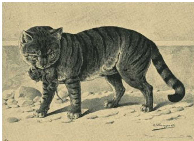
Fig. 14. Cyprien-Katze.

Die Cyprien-Katze (Fig. 14) ist gelbgrau mit schwarzen Querstreifen und es hat den Anschein, als ob sie auf der Insel Cypern mit Sorgfalt gezüchtet wurde. Nach Michel berichtet Villamont von dem Cap della Gatte (Katzenkap) auf Cypern, daß dort ein Kloster von den Türken zerstört wurde, worin sich Katzen befanden, die einen sehr wirksamen Krieg gegen die dort massenhaft vorkommenden Schlangen führten. "Die Schlangen", sagt er, "sind auf dieser Insel von schwarzweißer Färbung, zum mindesten sieben Fuß lang und gegen sechs bis acht Zoll dick; sie werden von den zum Kloster gehörigen Katzen gejagt und getötet. Mittags ruft eine Glocke des Klosters diese kühnen Jäger zum Mahle, aber sobald sie ihr Futter eingenommen, ziehen sie wieder ab, um die Verfolgung ihrer Feinde von neuem aufzunehmen."