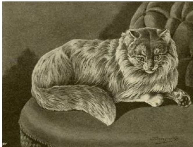
Fig. 17. Persische Katze.

Die Khorassan- oder persische Katze (Fig. 17) scheint eine Abart der Angora-Katze zu sein, ihr Haar ist indes etwas wolliger, lockiger, doch immerhin noch von besonderer Länge. Die Farbe ist dunkel-blaugrau. Was Schönheit anbelangt, steht sie der Angora-Katze ziemlich nahe, doch ist sie weit seltener wie Diese.