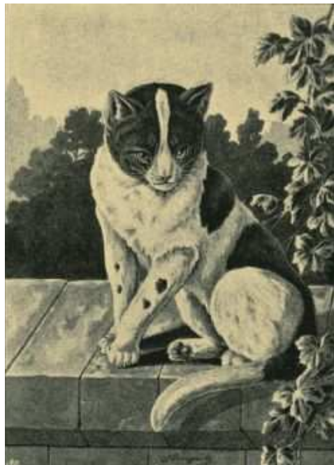
Fig. 13. Gefleckte Hauskatze.

Die maus- oder fahlgraue, gelbe und gescheckte Varietät (Fig. 13) ist die gemeinste und es giebt bei ihnen mancherlei Farbenabstufungen und Zeichnungen, so daß keine feste Norm für sie aufzustellen ist.