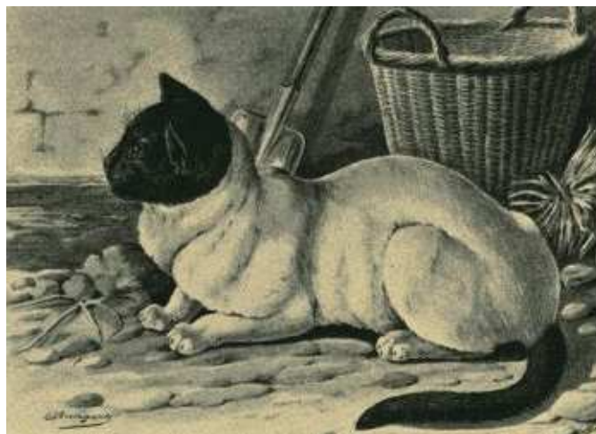
Fig. 12. Mohrenkopf-Katze.

Die Maskenkatze ist in der Regel tiefschwarz, zwischen den Augen befindet sich eine weiße Schnippe, ebenso sind Lippen, Schnurrhaare, ein Fleck an der Brust, der manchmal bis zur Kehle hinaufgeht, die untere Bauchseite und Pfoten reinweiß; auch bei einigen noch die Schwanzspitze. Die Augen sind bei dieser Varietät gelb und erscheinen die schwarze Umrahmung ziemlich leuchtend. Je regelmäßiger und bestimmter die weißen Abzeichen und je schärfer diese sich von der schwarzen Grundfarbe trennen, um so schöner ist die Maskenkatze, die viele Verehrinnen findet.