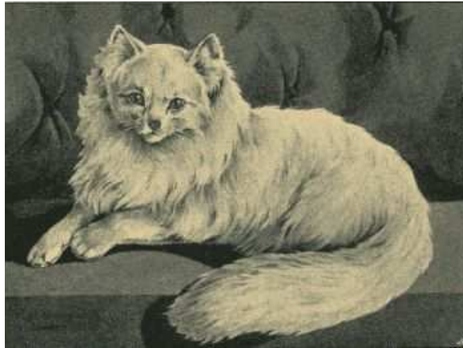
Fig. 16. Angora-Katze.

Von der Island-Katze heißt es, daß sie sich durch schöne blaugraue Färbung des Felles auszeichne; die Kumanische Katze, aus dem Kaukasus stammend, soll hingegen großflockiges Haar von weißer, schwarzer oder rostroter Farbe haben; Lippen und Sohlen fleischfarben.