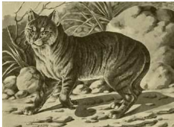
Fig. 20. Man- oder Stummelschwanz-Katze.

Die siamesische Katze (Fig. 19), aus Siam stammend, ist ein eben so seltenes wie schönes Tier und zeichnet sich durch kurzes, glattanliegendes Haar und die ihr eigentümliche Färbung aus. Die Farbe des Körpers ist isabellfarbig (hellgelblich-weiß), Gesicht, Ohren, Beine und Schwanz sind schwarzbraun. Keller schreibt, daß es besonders flinke Tiere sind, die in Asien in den Palästen gehalten und mit Fischen gefüttert werden. Diese Hauskatze dürfte nächst den langhaarigen eine der schönsten und teuersten sein, denn gute Exemplare werden oft mit 200 Mark und darüber bezahlt. Leider gelangt auch sie äußerst selten nach Europa und ist hier noch wenig bekannt.