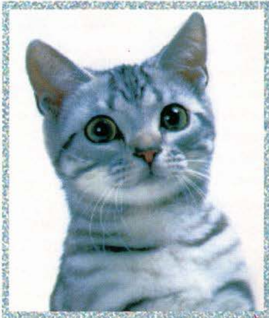
Ezüst cirmos brit rövid szőrű