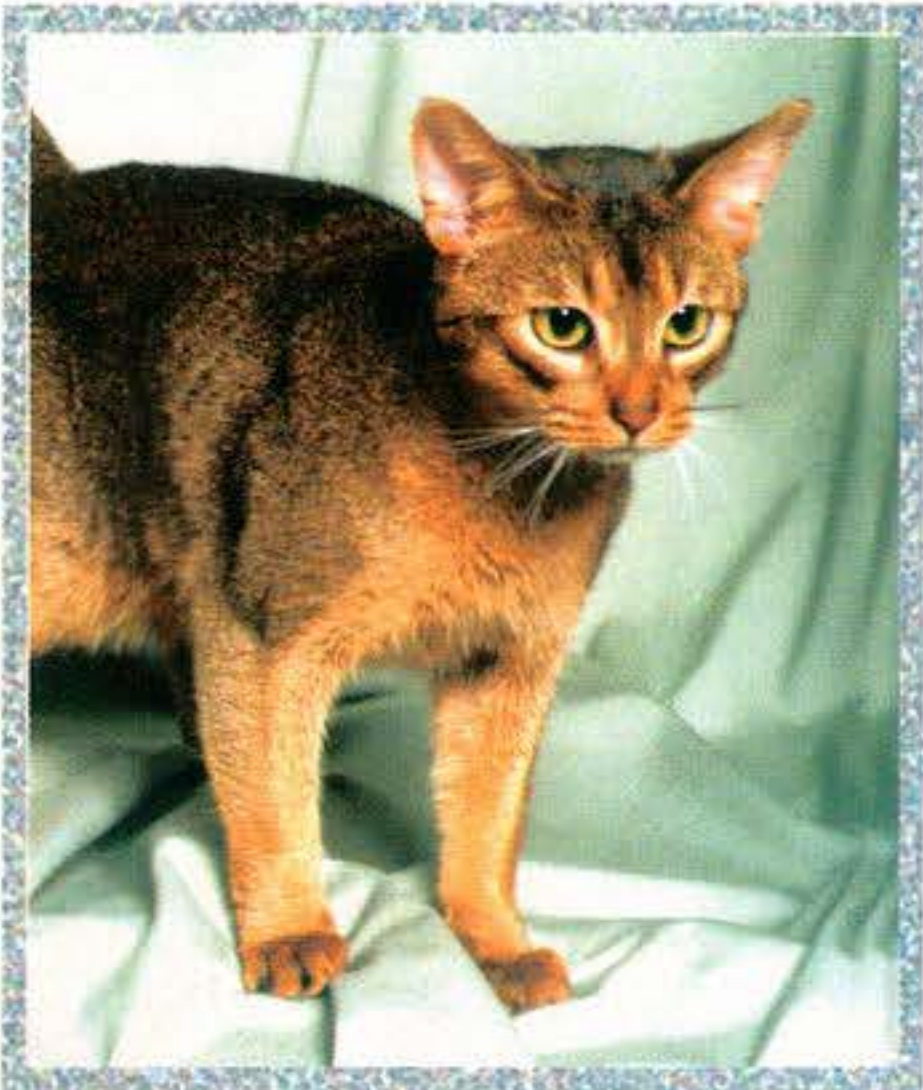
Vadas színű abesszin