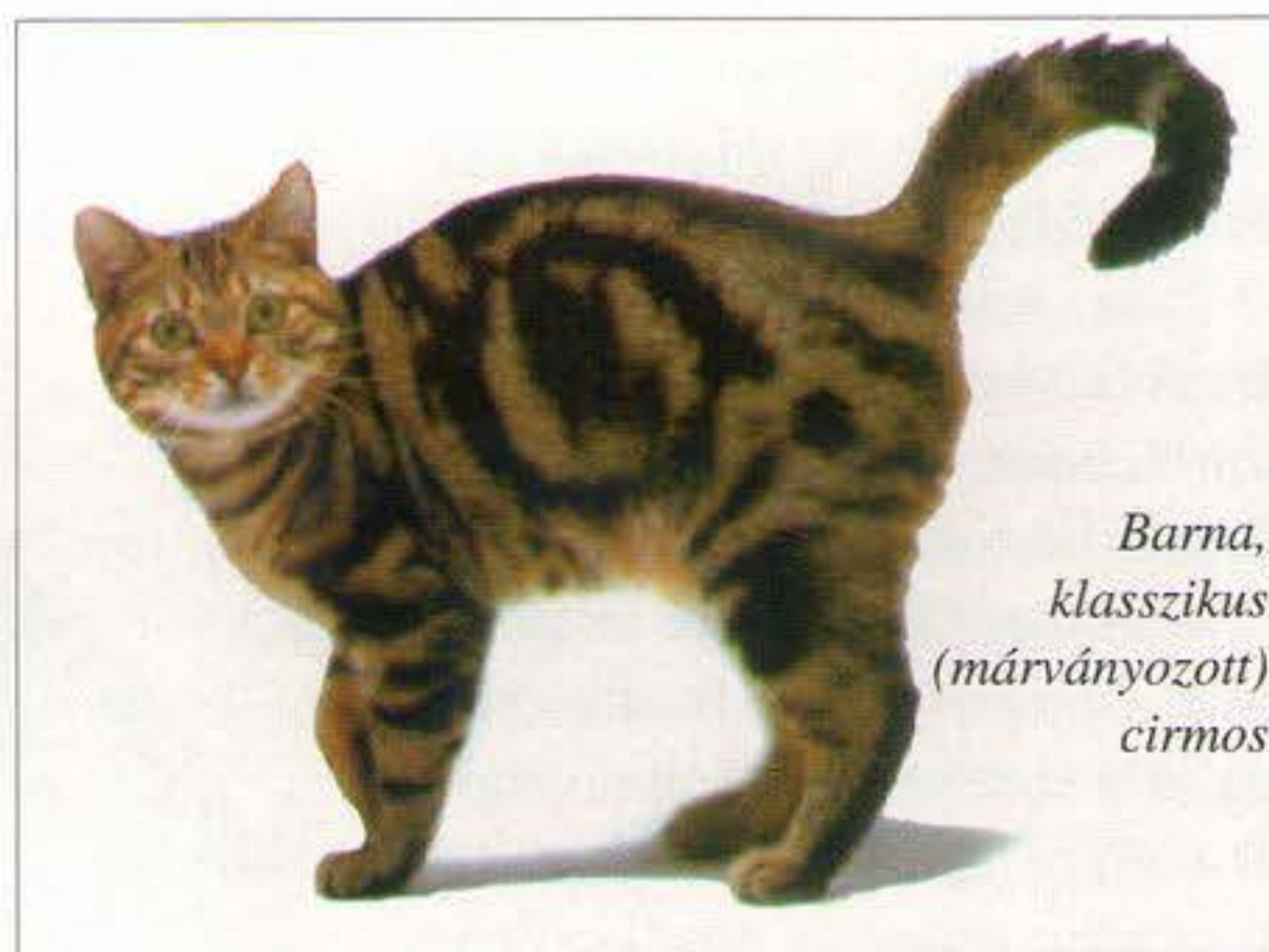
Barna, klasszikus (márványozott) cirmos

SZEMÉLYISÉG: Élénk, érdeklődő, de nem követelőző, barátságos, emberek és más állatok iránt bizalommal lévő. Csengő hangon nyávog, de nem zajos.