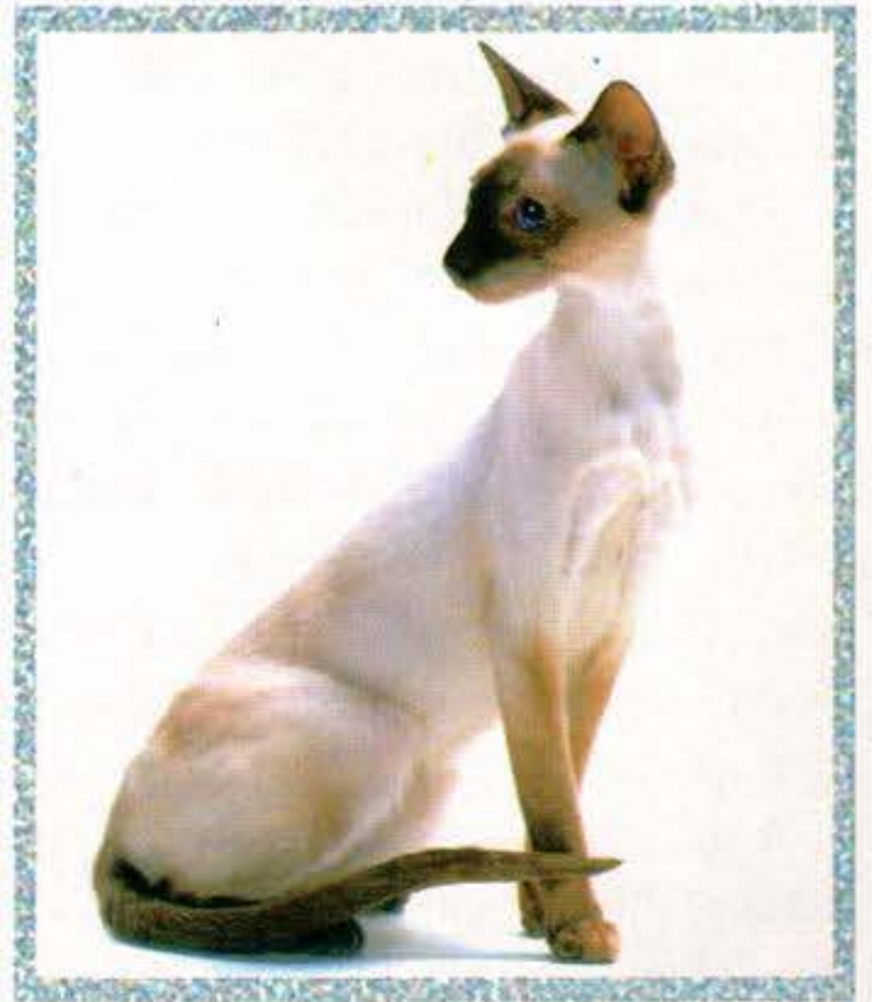
Fóka színjegyes sziámi