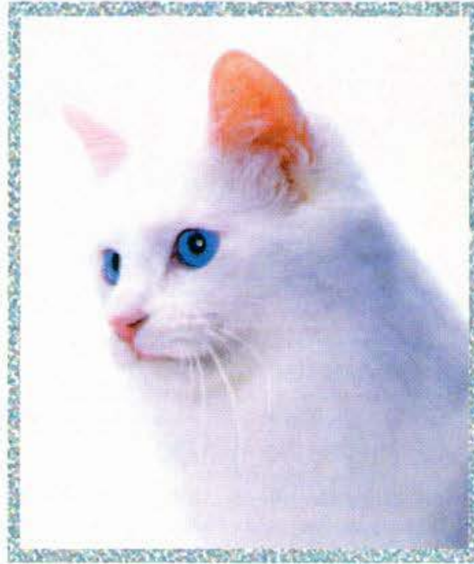
Török angóra kék szemmel