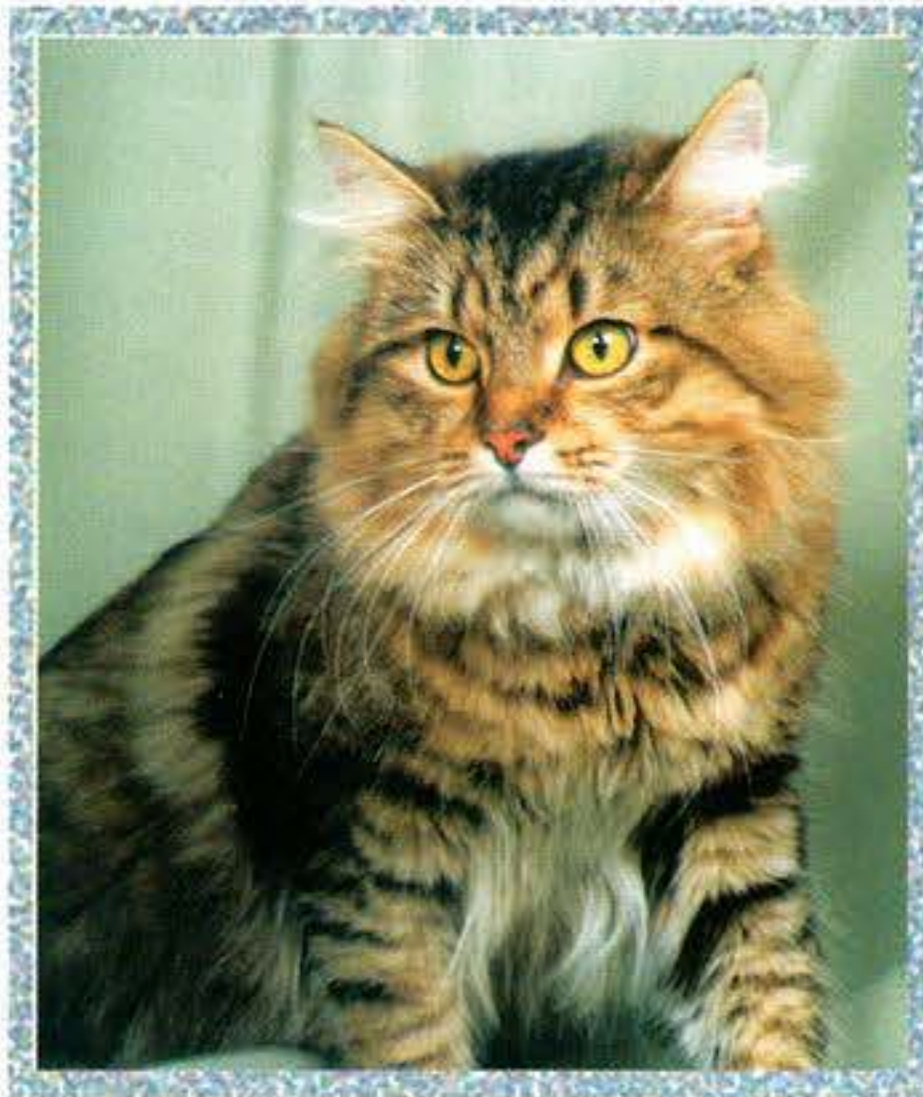
Barna cirmos szibériai