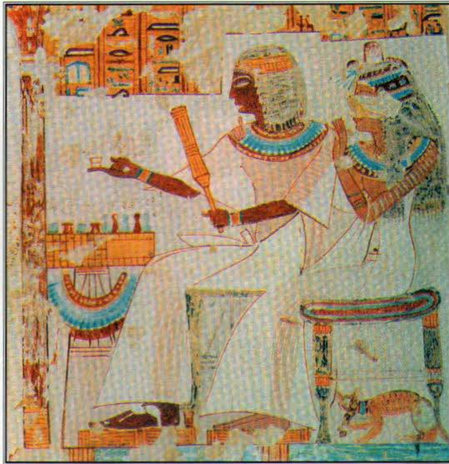
A ház úrnőjének széke alatt vidáman tanyázó macska az ókori Egyiptomban. A kb. i.e. 1950-ben készült meghitt jelenetet ábrázoló alkotásra Beni Hasszánban leltek

K ülönféle elméletek ismertek arra nézve, hogy vajon hogyan történt a vadmacska háziasulása. Abban azonban teljes egyetértés mutatkozik, hogy a házimacska őse az afrikai vadmacska ( Felis lybica ) volt. Általánosan elfogadott az is, hogy az afrikai vadmacskát az óegyiptomiak háziasították. Az első macskát ábrázoló falfestmény i.e. 3000 körül készült. Ti i.e. 2600-ból származó sírkamrájában egy nyakörves macskaábrázolás található, a nyakörv – ha még nem is háziasult – de legalábbis fogságban tartott állatra utal.